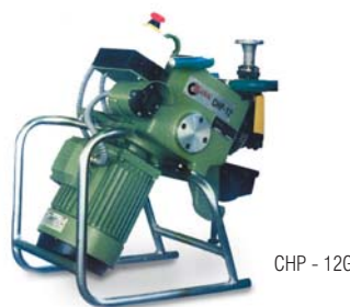
CHP - 12G