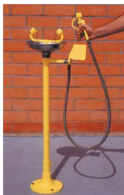
AS 308 B