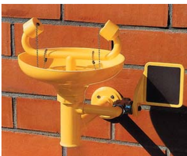
AS 310 P