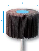
Ejecución Corindón A