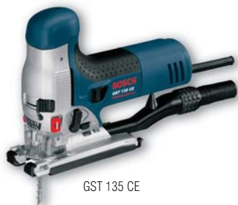
GST 135 CE