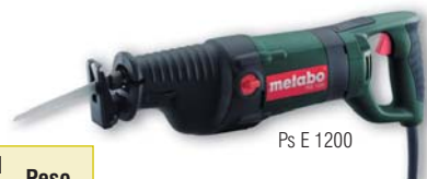
Ps E 1200