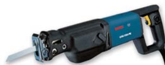
GSA 1100 PE