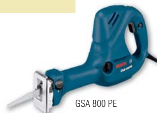
GSA 800 PE