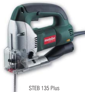
STEB 135 Plus