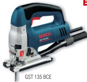
GST 135 BCE